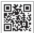
INCHEM TOKYO 2023 公式ウェブサイト

来場事前登録フォームにて事前登録をして、来場者マイページのログイン情報を取得してください。